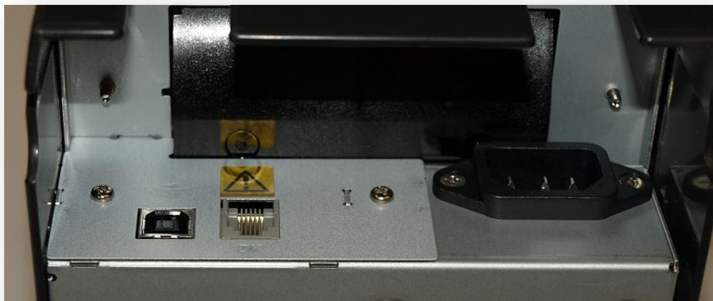
Bild på baksidan på kvittoskrivaren(OBS anslutningar kan variera beroende på kvittoskrivare)