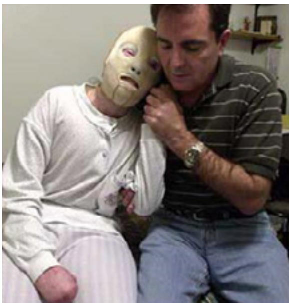
Tillsammans med sin far år 2000