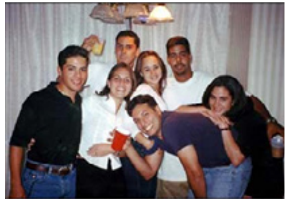
På fest med vänner