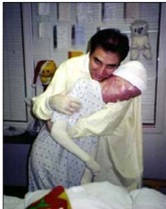
3 månader efter olyckan