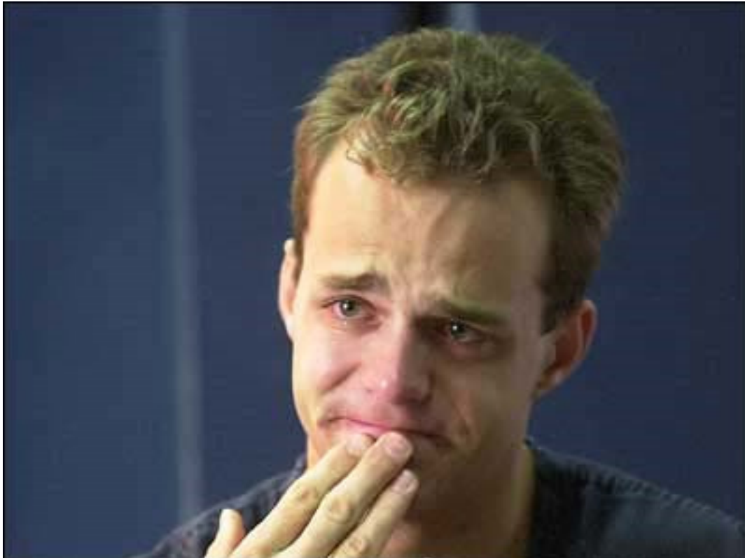
Tre år efter olyckan. 20 år gammal och han kan inte förlåta sig själv.